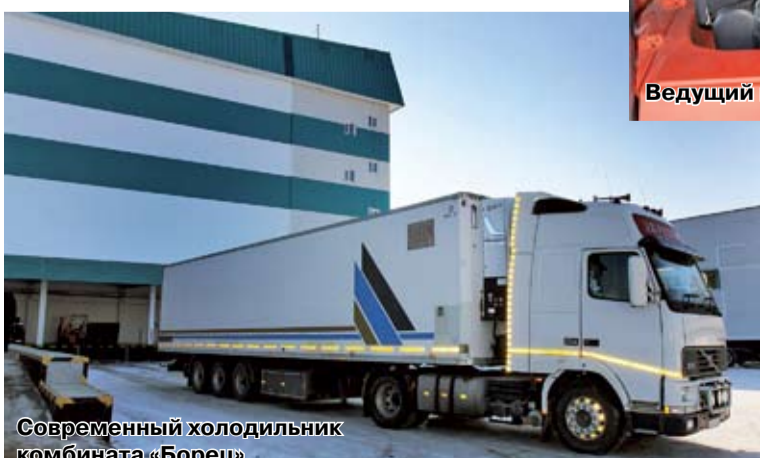
Современный холодильник комбината «Борец»