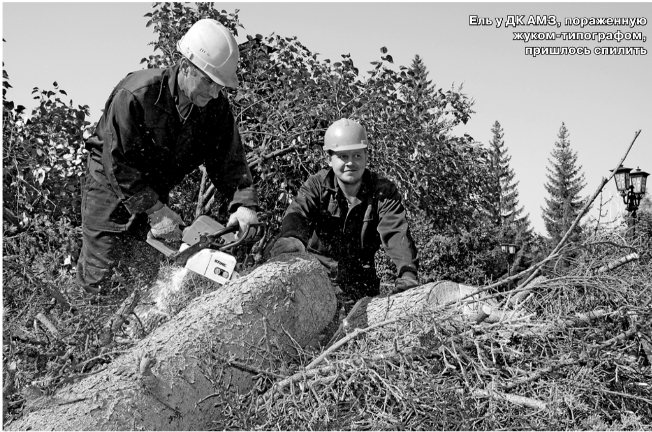
Ель у ДКАМЭ, пораженную жуком-типографом, пришлось спилить