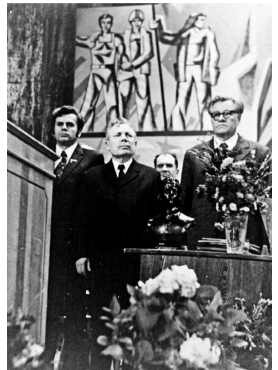
На торжественном собрании по поводу вручения АМЗ Переходящего Знамени ЦК КПСС, Совмина СССР, ВЦСПС и ЦК ВЛКСМ

— Ничего я не перебираю. Я еду не к тебе на блины, а на Все-