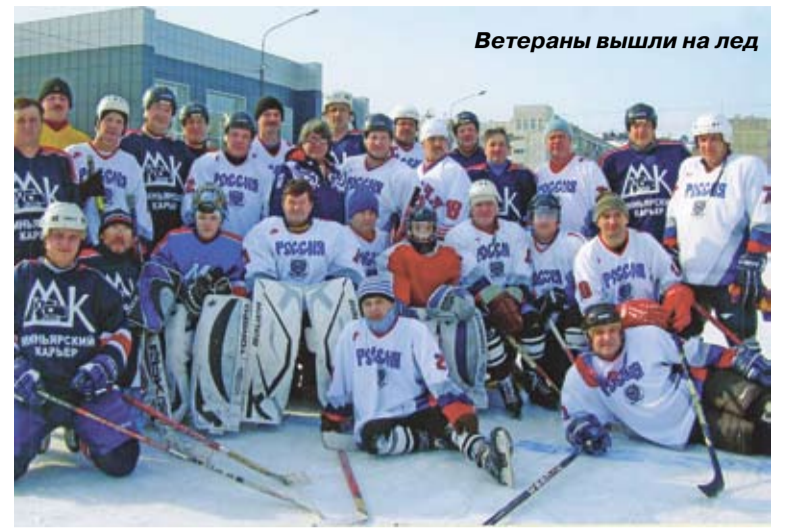
Ветераны вышли на лед