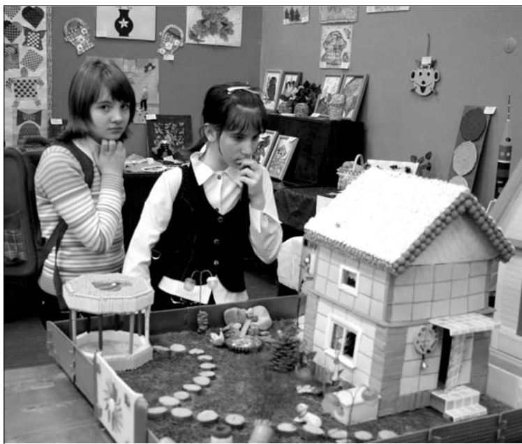
Дачная усадьба, выполненная учениками и учителями школы-интерната №5 г. Аши