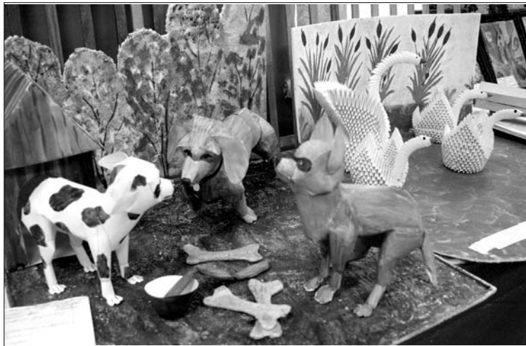
«Дружная семейка». Работа учащихся школы пос. Ук