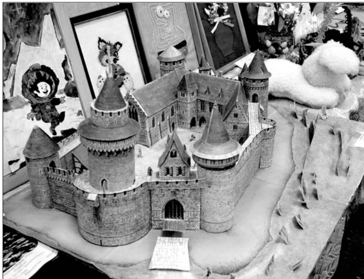
Старинный замок. Работа учащихся школы №7 г. Аши