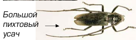
Большой пихтовый усач