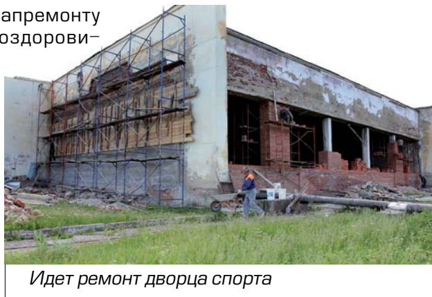
Идет ремонт дворца спорта

Ведутся работы по капремонту Симского спортивно-оздоровительного комплекса (СОКа).