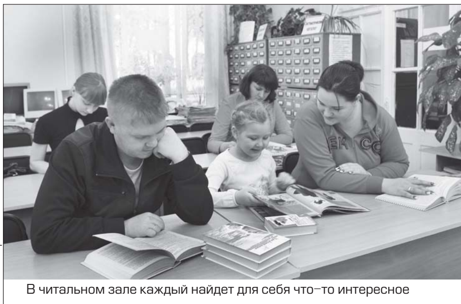
В читальном зале каждый найдет для себя что-то интересное