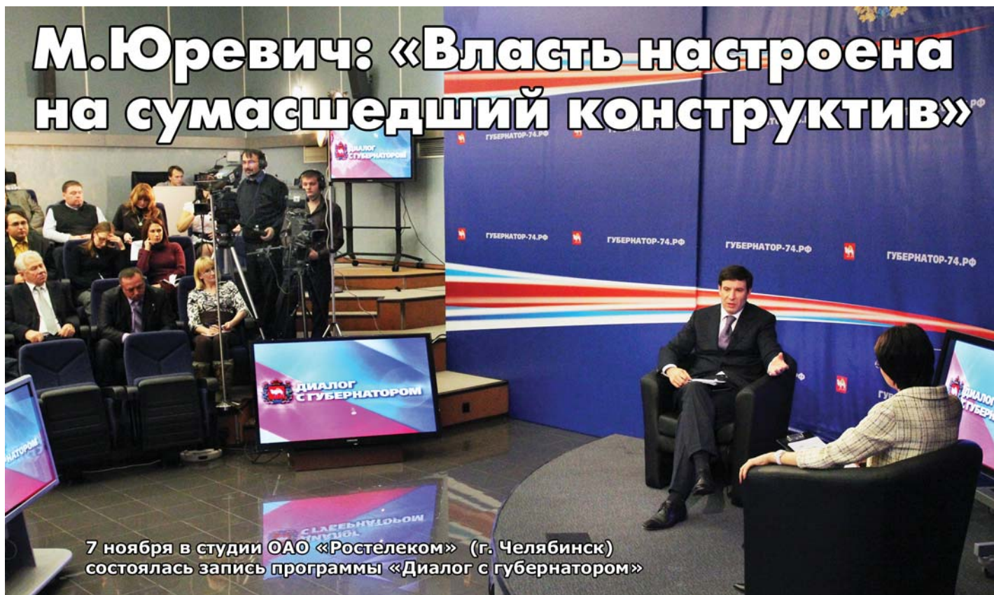
7 ноября в студии ОАО «Ростелеком» (г. Челябинск) состоялась запись программы «Диалог с губернатором»