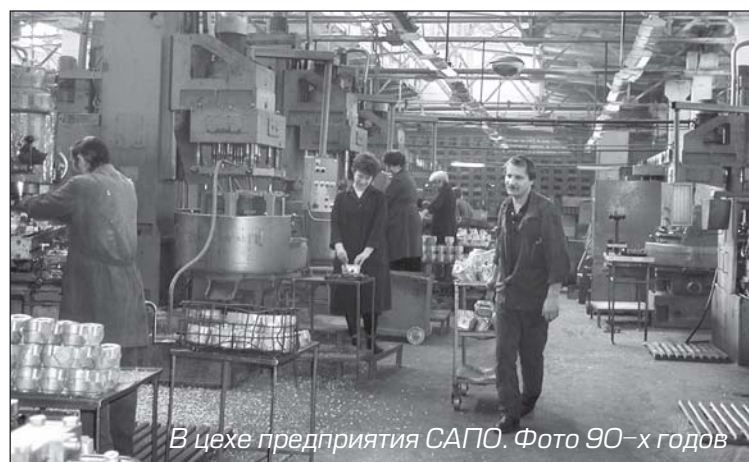
В цехе предприятия САПО. Фото 90-х годов