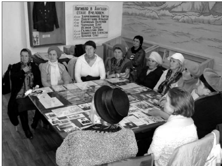
В Афганском зале посетители МУ «КЦСОН»