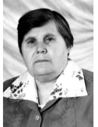
Муж, дочь, внучка