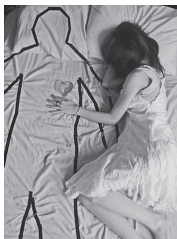
8 марта может быть и грустным праздником

история помнит его именно как международный символ стремления к полному и окончательному равенству, мечту, в реализацию которой верили очень многие в начале прошлого века. Верили и позже. Многие получились, пусть и не все. Международное сообщество подтвердило свою приверженность идее, выработало конвенции и программы, под которыми подписались практически все страны мира. Процесс этот практически неостановим. Опыт противоречивого советского эксперимента имел в данном вопросе чрезвычайное значение. Лучшее всего получилось в Европе. В России 90-х, в период очарования неолиберализмом, сама проблема женского равноправия была выброшена на свалку истории вместе со всеми завоеваниями социалистического прошлого, и даже новорожденное общественное движение под лозунгом «Демократия минус женщины» не смогло изменить идеологический вектор. Жизнь, впрочем, рассудила по-своему, и женщины не только внесли свой спасительный вклад в преодоление переходного периода, но и завоевали несомненное уважение сограждан в решении важнейших практических вопросов жизни страны. И тот факт, что в парламенте заседает пока около 10 процентов депутатов в юбках - это временное явление, несомненно. Незадолго до столетия Женского дня министр Голикова зая-