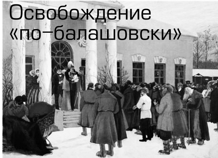
Чтение Манифеста об освобождении крестьян от крепостной зависимости

хлебопашеством и на заводах должны были в качестве вольнонаёмных выполнять вспомогательные работы.