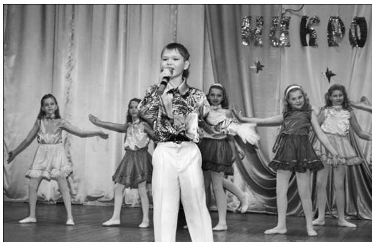
«Волшебный микрофон» всегда собирает много участников и зрителей