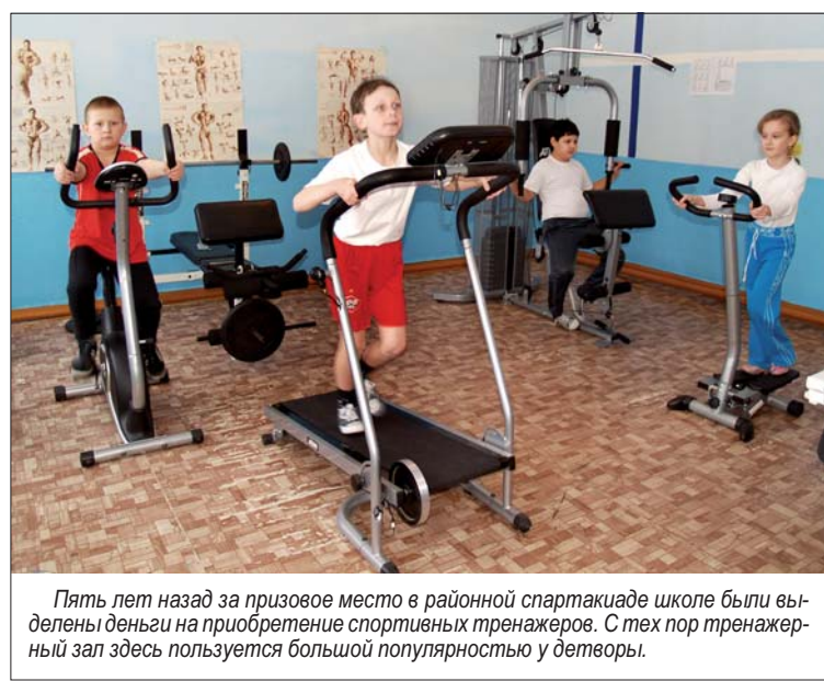
Пять лет назад за призовое место в районной спартакиаде школе были выделены деньги на приобретение спортивных тренажеров. С тех пор тренажерный зал здесь пользуется большой популярностью у детей.

Двери школы открыты для всех, недаром ее можно назвать центром культурно-спортивной жизни микрорайона «АХЗ». Совместно с жителями микрорайона проводятся праздники 1 и 9 мая, «День защитника Отечества»; КВН «Весна», «День здоровья», вечера отдыха. Учитывая, что наша школа удалена от центра города, силами учителей организованы кружки и секции: фольклорный, спортивные танцы, вокальный, лево-конструи-