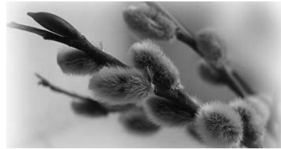
Мне жизнь казалась грустным сном – С того и плачет бабьим летом Моя берёзка под окном.

*** Искал я в травах звёзды неба, Искал в ручьях я свет луны, Где вновь меня смуцала верба Стыдливой весточкой весны. И, не умея жить иначе, Я ждал прилёта журавлей, Чтоб ранить сердце птичьим плачем Под шум багряных тополей. И вновь, печалась лунным светом,