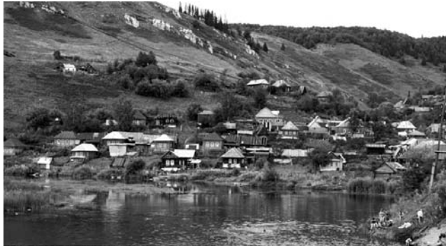
Смуцал я сердце майским эхом грома, Чтоб снились мне старинный городок И белая черёмуха у дома.

Влюблён я с детства в горный уголок, Где каждая дорожка мне знакома, И в маленький старинный городок С цветущей черёмухой у дома. Влюблён я с детства в крики журавлей И в щебет птиц, поющих дружным хором, А дом и двор казались мне милей От лёгких кур под стареньким забором. И где-то вновь у тёплого костра Встречал я ночь, прикрывшись тишиной, Где соловьи до самого утра Как будто в душу плакали весною. И вдалеке от солнечных дорог