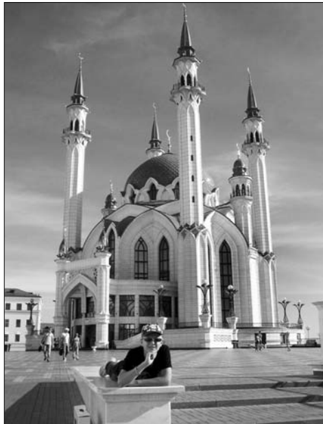
Мечеть Кул Шариф, г. Казань, 2011 г.

... О путешествии во Львов мы мечтали целый год, после того как случайно увидели в Интернете фотографии этого города. «Не боитесь? — интересовались друзья, — там ведь, говорят, русских не любят». «Это же Украина, там наши!», — беспечно отвечали мы. Во Львов ехали на поезде, где с нами никто не разговаривал. Стоило обратиться к кому-то по-русски, как в купе повисала тишина, а проводник демонстративно отворачивался. За окном мелькали выжженные поля, заброшенные колхозы, сёла, хаты. Затем пошёл лес, а за ним, как в сказке, вырос необыкновенной красоты город. Сердце бешено колотилось — мечта сбылась!